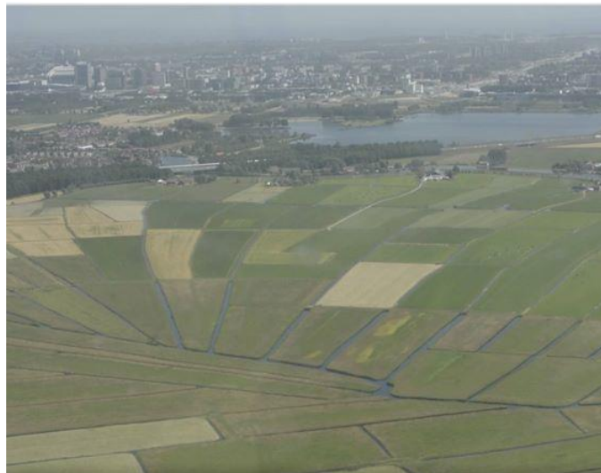
Rondehoep met een bont patroon van kleuren door het afwisselende graslandbeheer.

Dat het aantal broedvogels stabiel is, valt te begrijpen: de beide polders zitten tot de rand toe vol grutto's, er kan niet meer bij. Waar blijven de nieuwe vogels dan? Ook dat hebben we in beeld: de aantallen ten zuiden van deze polders, in de Utrechtse regio Ronde Venen, groeien. Ook daar is een effectief beheer voor deze soort.